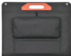
składana konstrukcja /foldable design